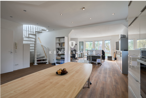
Blick in den Wohnbereich