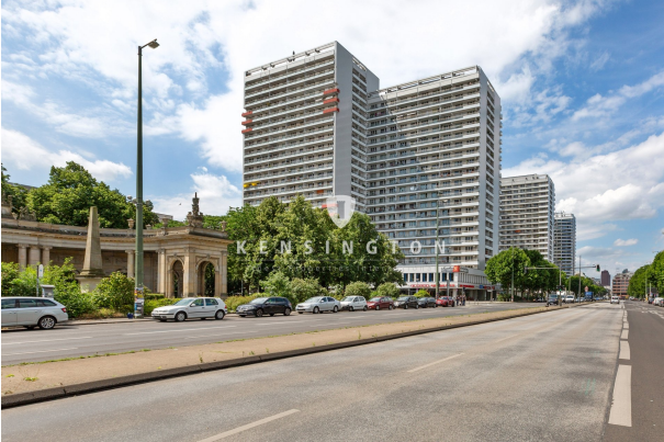
Hausansicht von vorne