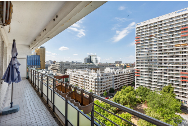
Blick vom großen Balkon