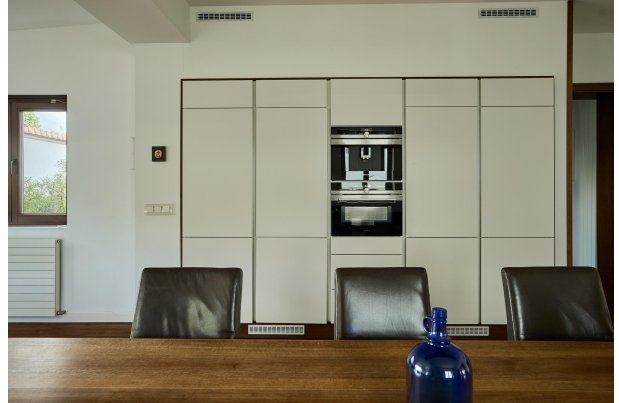
Einbauküche mit Kaffeeautomat