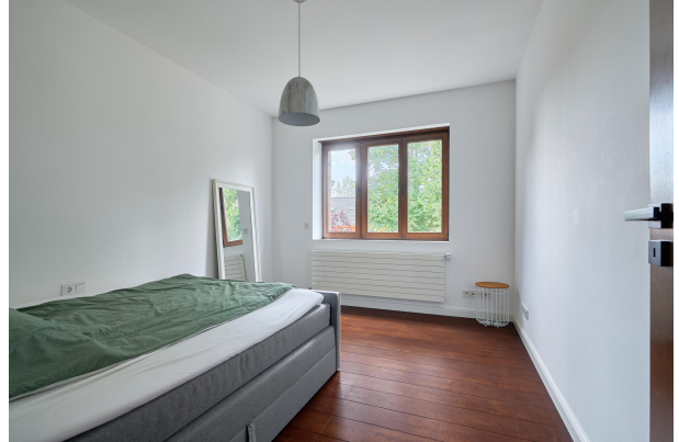
Weiteres Schlafzimmer im Obergeschoss