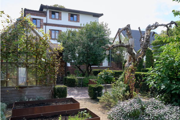
Garten von der Königlichen Gartenakademie