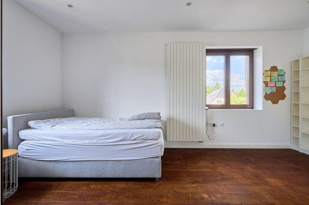
Schlaf oder Kinderzimmer