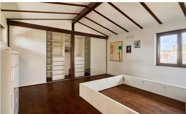
Schlafzimmer im Dach mit Klimaanlage und Einbauschränk