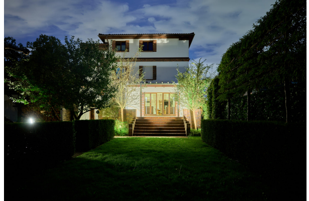
...sorgt auch für angenehme Abendstunden