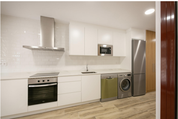
_MR_1116 copia 2