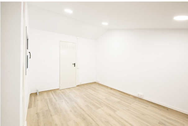
_MR_1156 copia 2