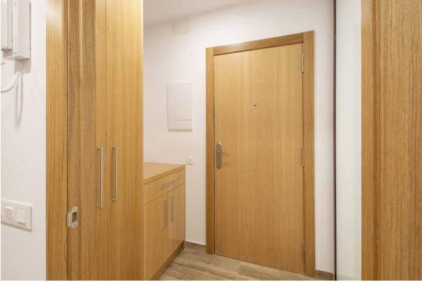
_MR_1119 copia 2