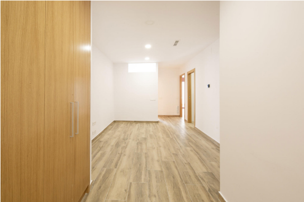
_MR_1121 copia 2