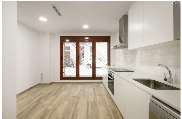
_MR_1108 copia 2