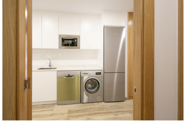
_MR_1120 copia 2