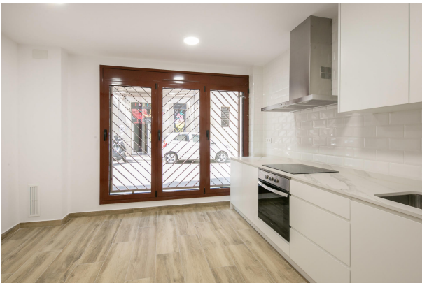
_MR_1111 copia 2