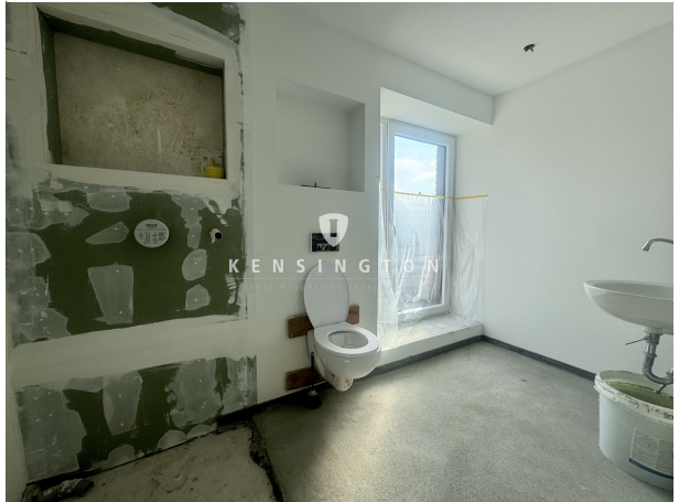
OG | Masterbad 2