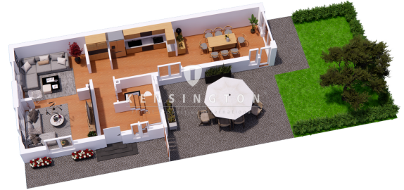
Erdgeschoss 3D Flur Perspective View final