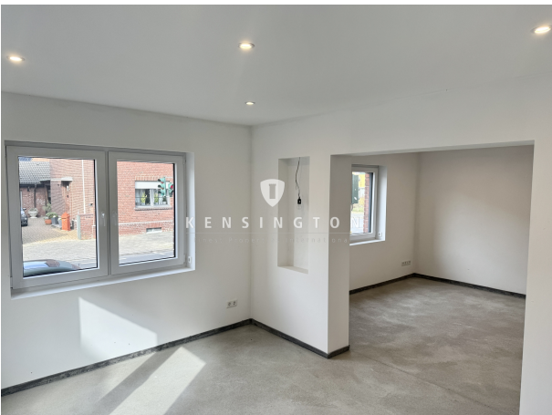
EG offener Wohnbereich 2