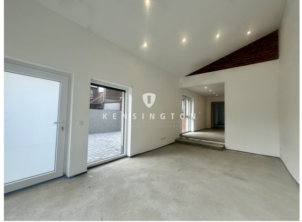
EG Anbau Blick zur Küche vom Esstrakt fi