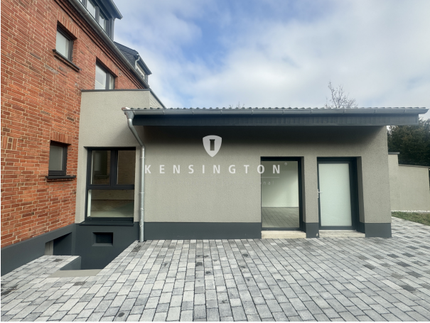
Rückseite mit seitlichem Blick auf den Anbau