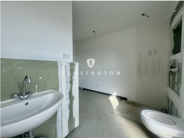
OG | Masterbad