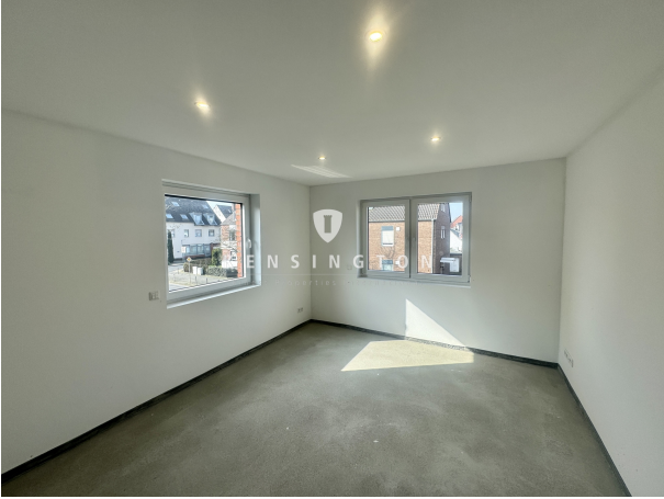
OG | Schlafzimmer I