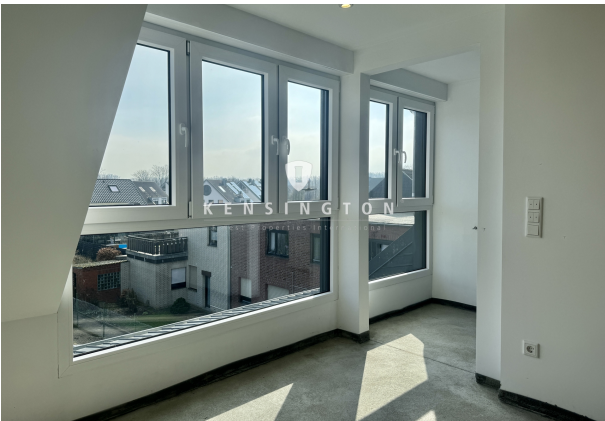
DG mit Zugang zum Badezimmer En Suite mit Grosser Dusche