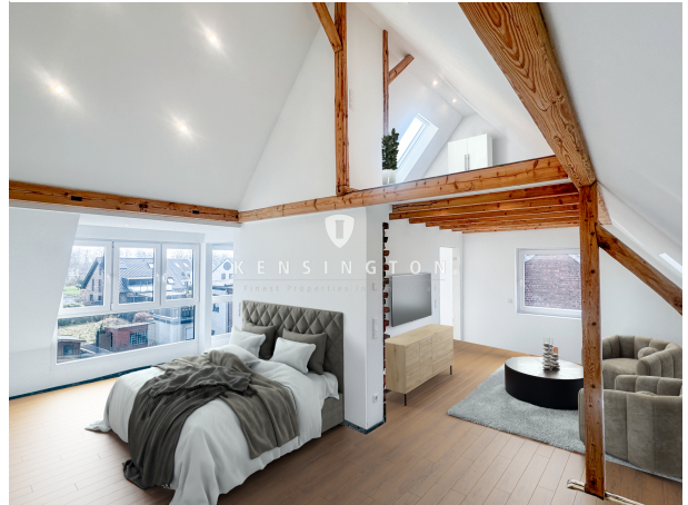
Einrichtungsbeispiel DG mit Spitzboden final