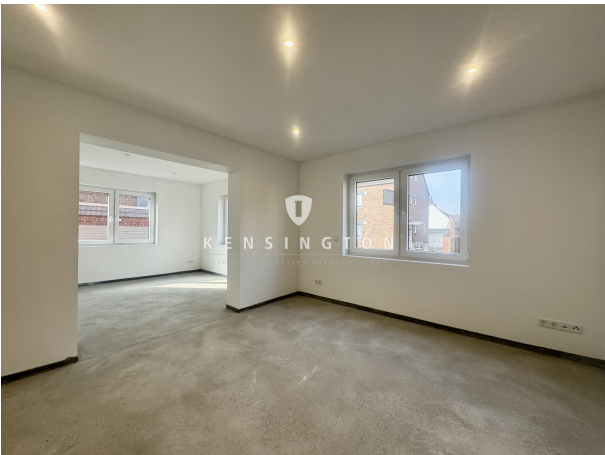
EG offener Wohnbereich