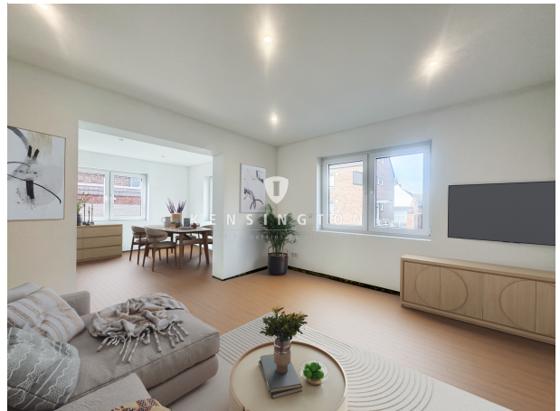
EG offener Wohnbereich final