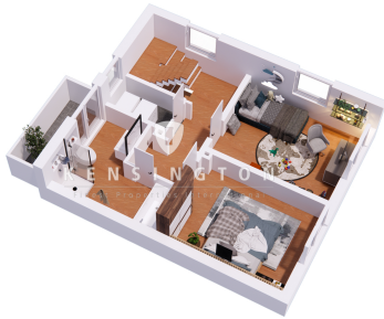
Obesgeschoss 3D Flur Perspective View final