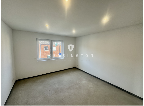
OG | Schlafzimmer II