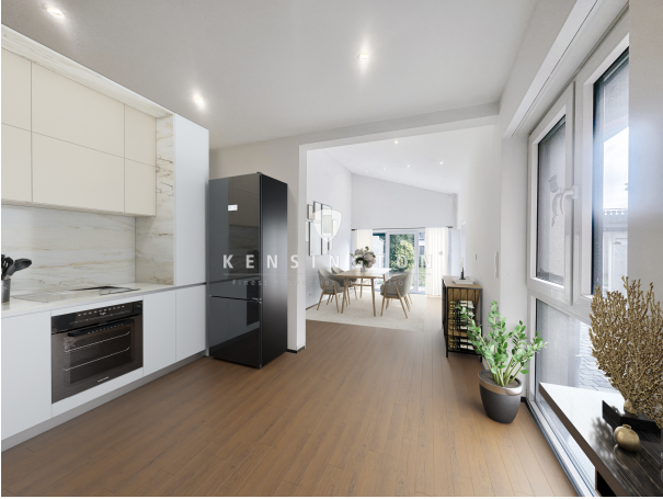
EG Anbau offene Küche mit Esstrakt final