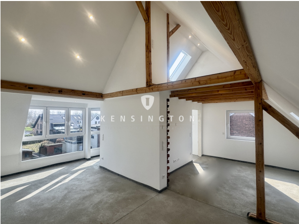
DG mit Spitzboden & Duschbad