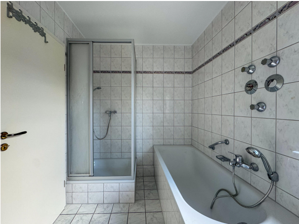
Badezimmer mit Dusche und Badewanne