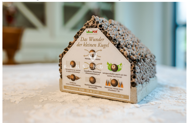
Natürlich gebaut mit der Wunderkugel!