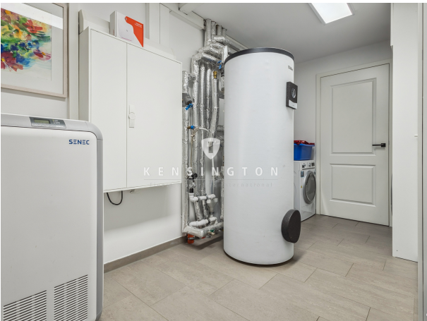
Technik auf höchstem Niveau!