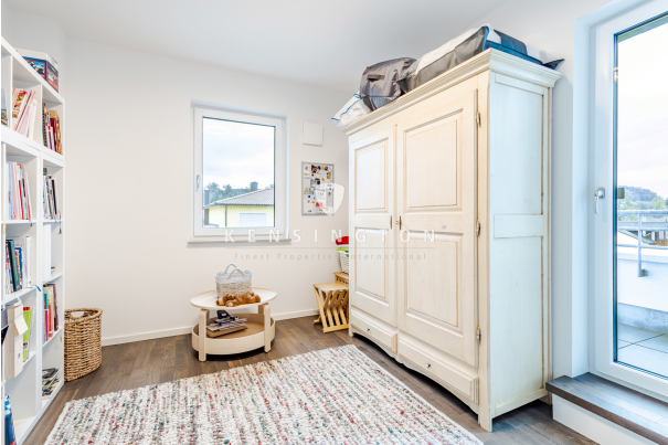
Lese-, Yoga-, oder als Entspannungsraum!