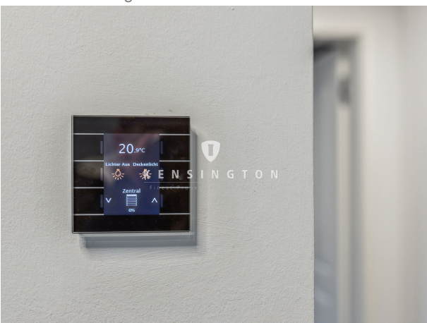
SmartHome im gesamten Haus!