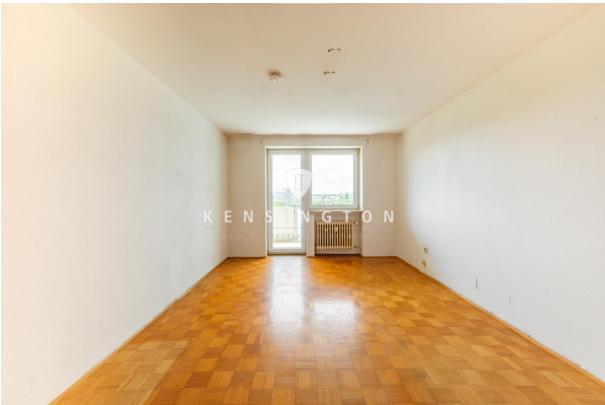
Schlafzimmer mit viel Licht