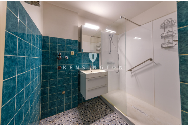
Badezimmer mit einem Platz für Ihre Waschmaschine