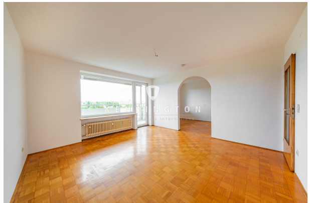
Wohnzimmer mit Blick auf den Balkon