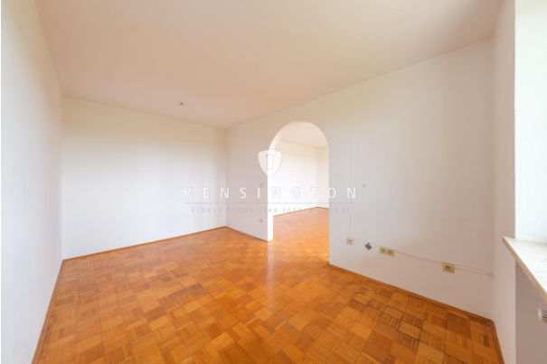
Esszimmer mit Durchgang