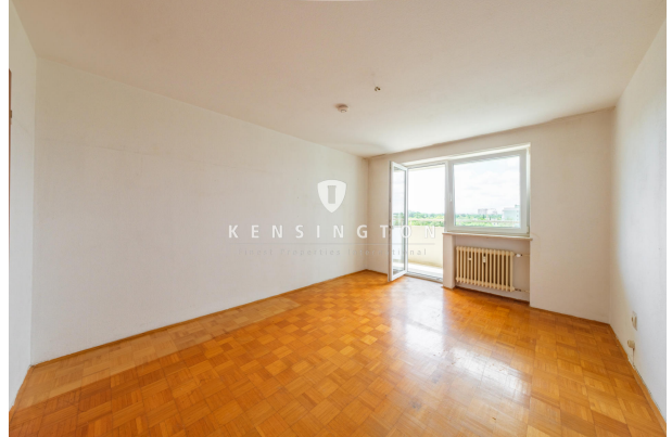
Schlafzimmer mit Zugang zum Balkon