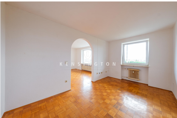
Esszimmer mit viel Licht