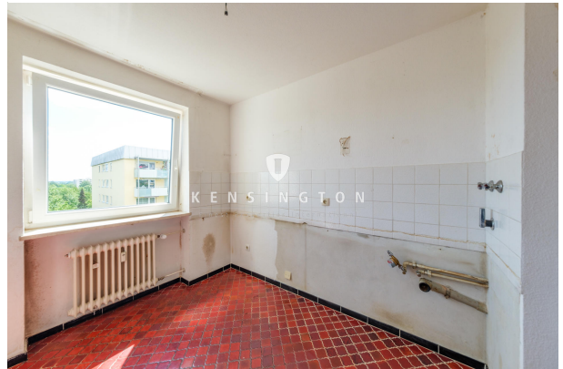
hier ist der Platz für Ihre neue Küche