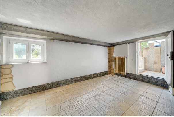
EG (unverbindliche Illustration)