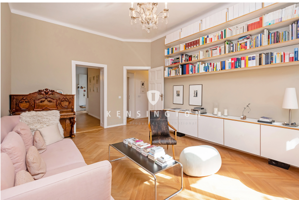
Wohnzimmer mit Blick zur Küche