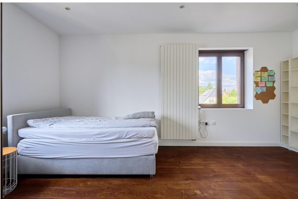
Schlaf oder Kinderzimmer