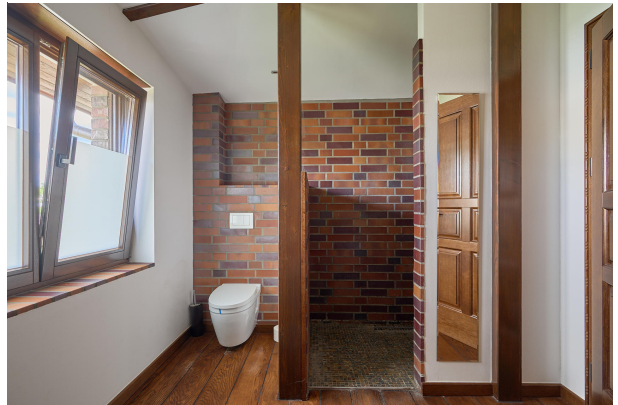
Hochwertige Handarbeit, nicht nur im Badausbau