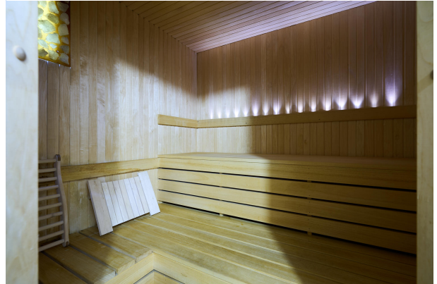
Moderne Sauna mit Dusche im Keller