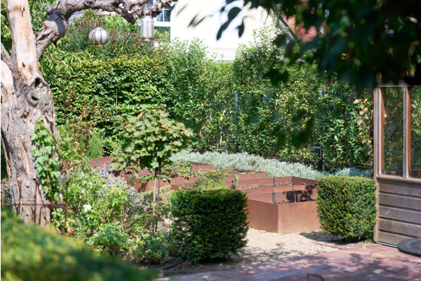
Beete mit intelligentem Bewässerungssystem