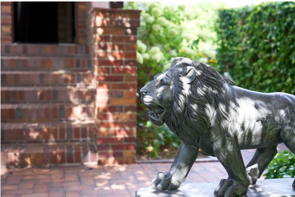
Schwere Plastiken im Garten