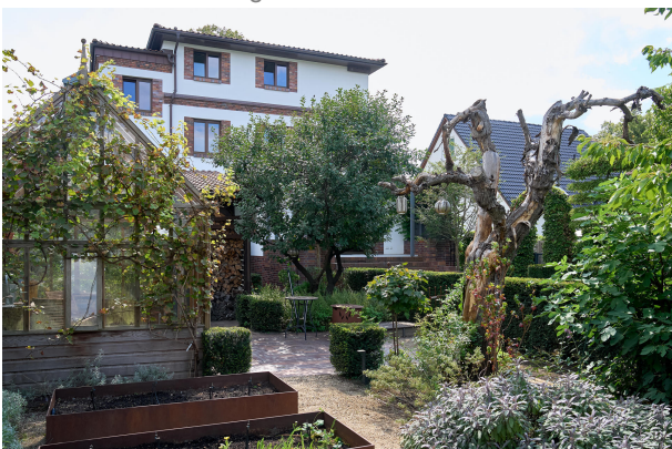
Garten von der Königlichen Gartenakademie