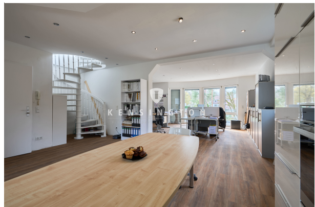
Blick in den Wohnbereich